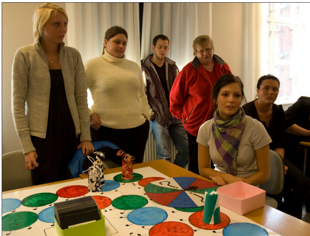
Social- og sundhedshjælperelver som arbejder med læringsstile på SOSU Nord.

Arbejdet med læringsstile på SOSU Nord er i tråd med den politiske ånd, da der i Ungepakke 2009 bliver fremhævet, at uddannelsesinstitutionerne skal have fokus på "udvikling af undervisningsmetoder, som i større udstrækning imødekommer elevernes forskellige læringsstile."