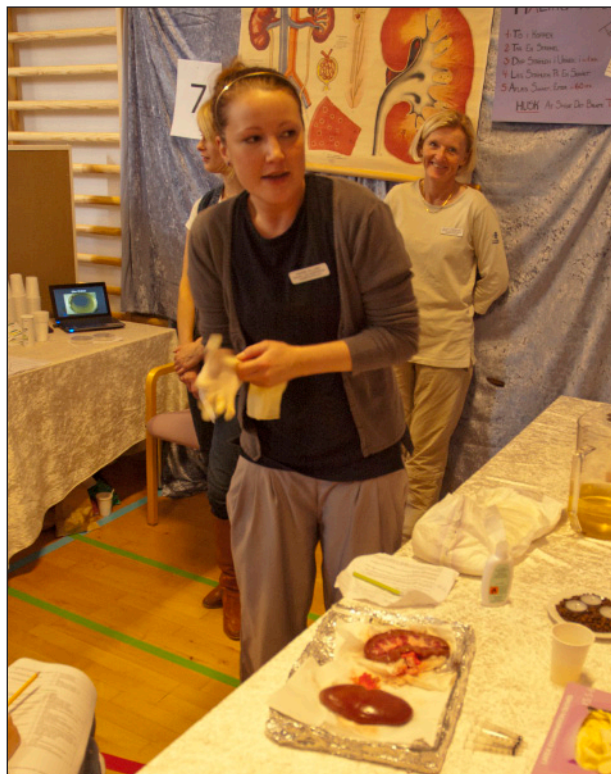
Måling af blod-sukker og foredrag om nyrens funktion var blot noget af det man kunne opleve på workshop dagen.